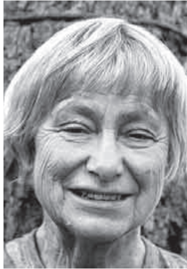
Dorothee Sölle (1929 – 2003)